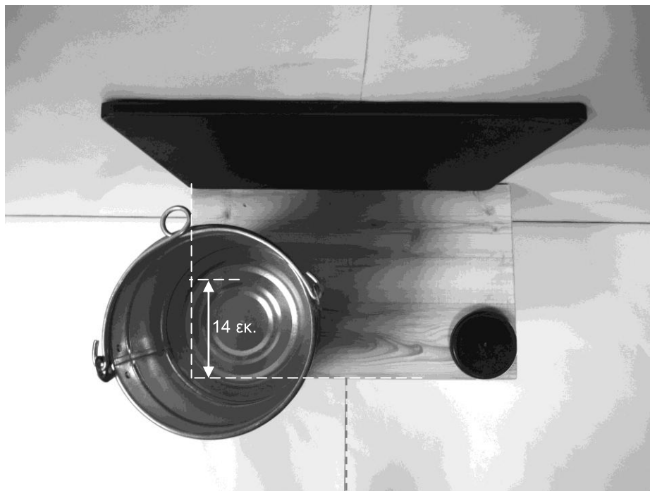
δεύτερη φωτογραφία: κάτοψη