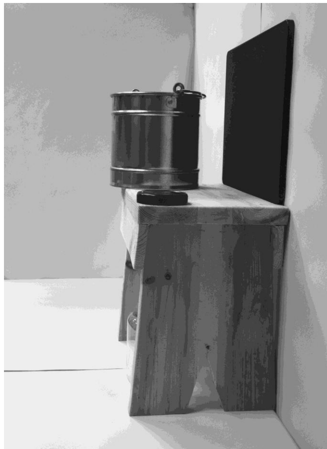
τέταρτη φωτογραφία: πλάγια όψη 2